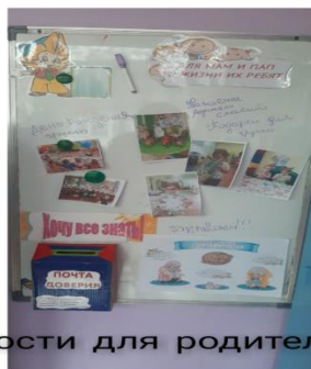
Новости для родителей.