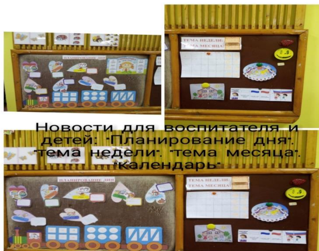
Новости для воспитателя и детей: «Планирование дня», тема недели, тема месяца, календарь»